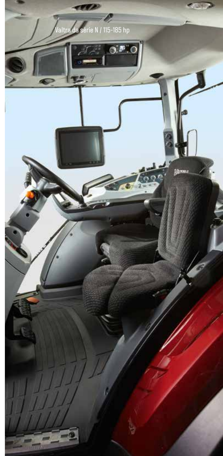
Valtra da série N / 115-185 hp

Compacto por fora, mas espaçoso por dentro. Sente- se no banco do condutor e relaxe. Não comprometemos o conforto e a segurança.