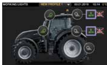
É fácil configurar as luzes de trabalho e o ecrã de 9 polegadas. Existem ainda os botões ligar/desligar para as luzes de trabalho e o farol no apoio do braço.