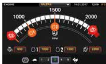
Configurações lógicas através de gestos táteis. Todas as configurações são automaticamente armazenadas na memória.