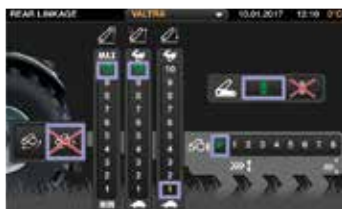
O ecrã de 9 polegadas, os controlos grandes, as definições e as funções são de fácil compreensão.