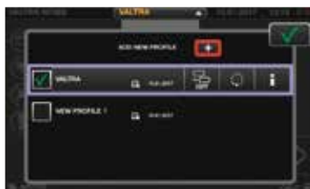
Perfis para os operadores e acessórios que podem ser facilmente alterados a partir de qualquer menu do ecrã. Todas as alterações de configurações serão guardadas no perfil selecionado.