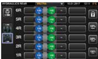
Pode atribuir qualquer controlo para operar qualquer função hidráulica, incluindo as válvulas hidráulica dianteira e traseira, as ligações dianteira e traseira e o carregador frontal.