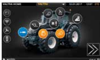
Estrutura de menus de fácil navegação.

O Smarttouch da Valtra elevou a usabilidade a um outro nível. É mais intuitivo que o seu Smartphone. As configurações são facilmente acessíveis com apenas 2 toques ou arrastar de ecrã e toda a tecnologia está integrada num novo e fácil de usar formato: Autoguiado, ISOBUS, Telemetria, AgControl e TaskDoc.